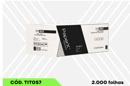
CÓD. TIT057 2.000 folhas