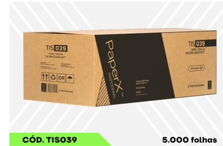
CÓD. TIS039 5.000 folhas

DISPENSERS COMPATÍVEIS: CÓD. EL-INTBP BRANCO / PRETO | CÓD. EL-INMBP BRANCO / PRETO