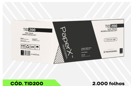
CÓD. TID200 2.000 folhas

DISPENSERS COMPATÍVEIS: CÓD. EL-INTBP BRANCO / PRETO | CÓD. EL-INMBP BRANCO / PRETO