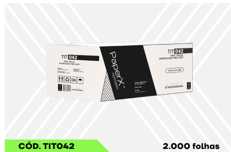
CÓD. TIT042 2.000 folhas

DISPENSERS COMPATÍVEIS: CÓD. EL-INTBP BRANCO / PRETO | CÓD. EL-INMBP BRANCO / PRETO