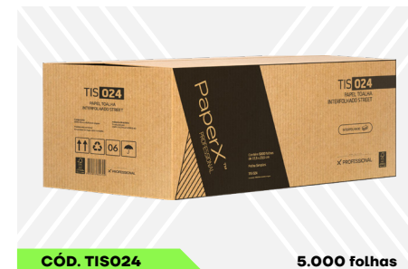
CÓD. TIS024 5.000 folhas

DISPENSERS COMPATÍVEIS: CÓD. EL-INTBP BRANCO / PRETO | CÓD. EL-INMBP BRANCO / PRETO