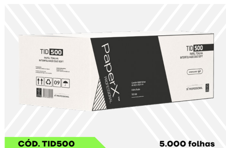
CÓD. TID500 5.000 folhas

DISPENSERS COMPATÍVEIS: CÓD. EL-INTBP BRANCO / PRETO | CÓD. EL-INMBP BRANCO / PRETO