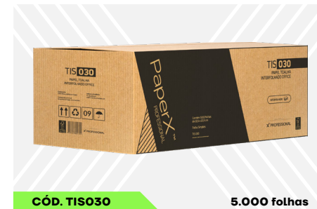
CÓD. TIS030 5.000 folhas

DISPENSERS COMPATÍVEIS: CÓD. EL-INTBP BRANCO / PRETO | CÓD. EL-INMBP BRANCO / PRETO