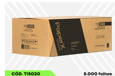
CÓD. TIS020 5.000 folhas

DISPENSERS COMPATÍVEIS: CÓD. EL-INTBP BRANCO / PRETO | CÓD. EL-INMBP BRANCO / PRETO